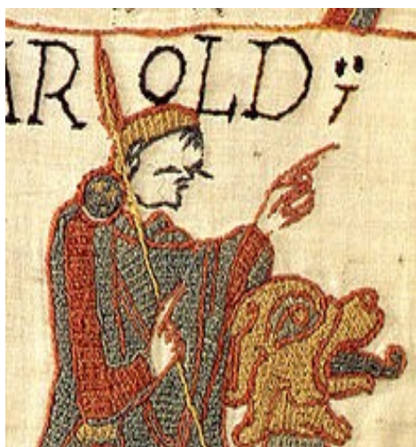
Le Comte Harold, 1064