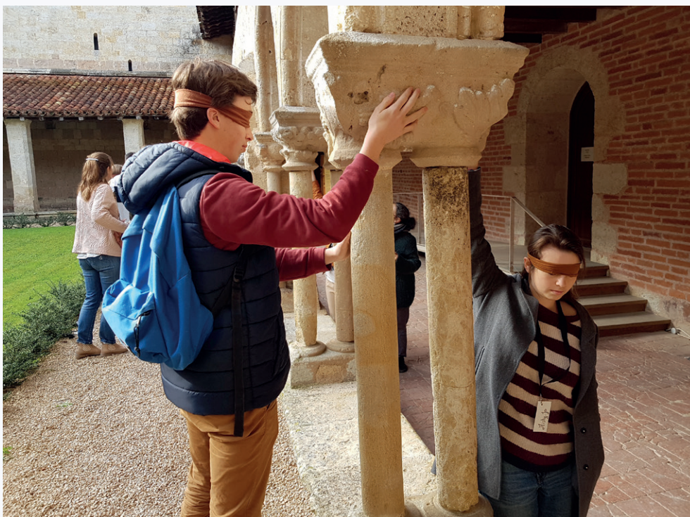
Visites proposées par l'abbaye de Flaran axées sur l'accessibilité/inclusion des personnes en situation de handicap ou avec des besoins éducatifs particuliers.