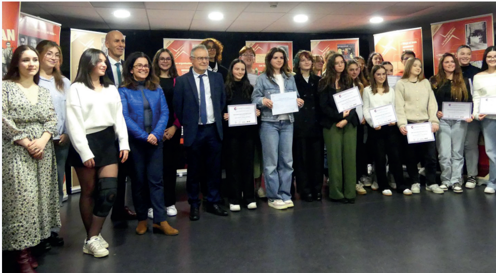
Lauréats 2024 du concours national de la résistance et de la déportation (cnrd)