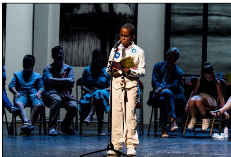
Kendjy, Champion Outre-mer (Martinique) et Grand champion 2025 à la Comédie-Française

Inscrire votre classe offre à vos élèves l'opportunité de développer leur goût pour la lecture et leur confiance en eux, des compétences essentielles pour leur avenir.