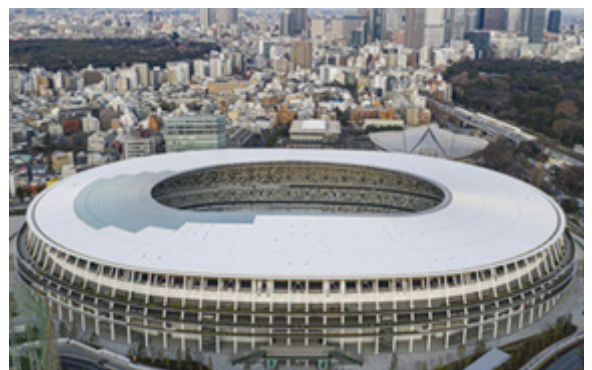
Le stade olympique de Tokyo 2021

De nos jours, les JO proposent de grandes rencontres sportives internationales pour encourager la pratique sportive et la fraternité entre les peuples . Les valeurs de l'olympisme (excellence, amitié, respect) sont universelles : elles sont valables à toutes les époques, dans tous les pays. C'est pour cette raison que les JO enthousiasment toujours autant, près de 3 000 ans après leur création.