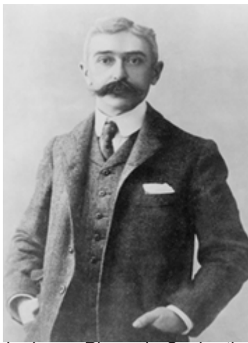
Le baron Pierre de Coubertin