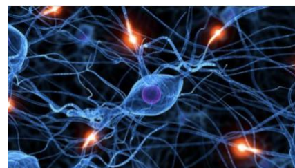
Pédagogie efficace de la mémoire aux cycles 3 et 4